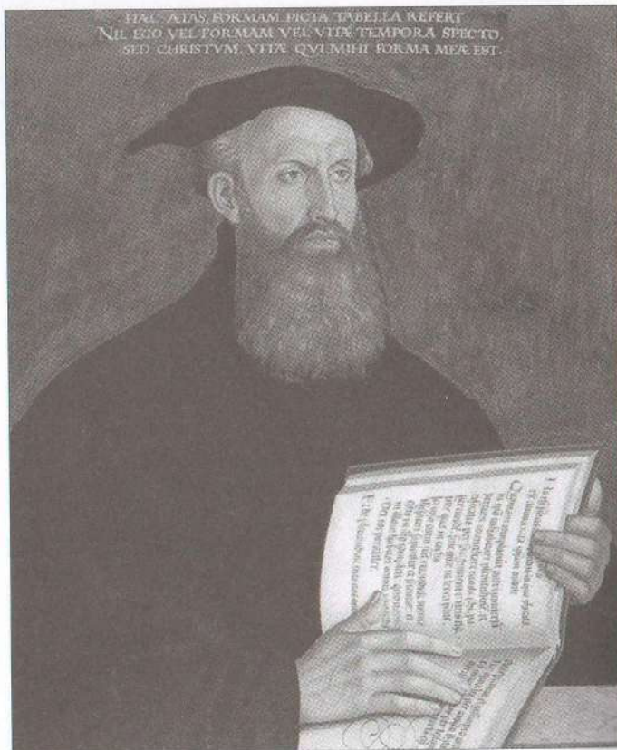
Heinrichas Bulingeris – Antrojo šveicariškojo išpažinimo sudarytojas (dail. Hans Asper; Zürich, Zentralbibliothek, Graphische Sammlung).